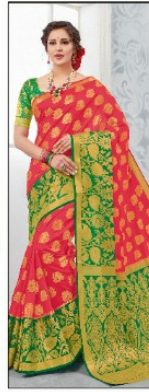
CODE # 2604