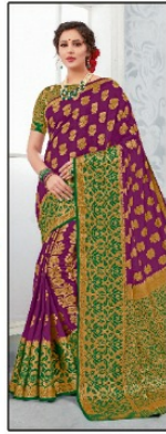
CODE # 2607