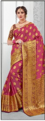
CODE # 2601