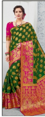
CODE # 2603