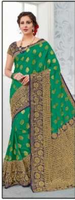
CODE # 2606