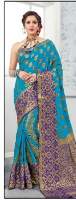
CODE # 2608