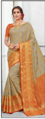
CODE # 2602