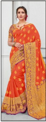
CODE # 2605